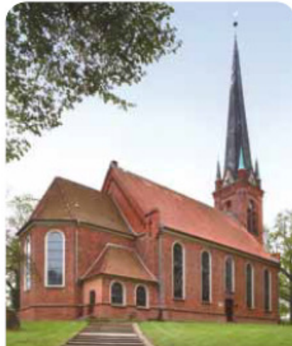
Peter-Paul-Kirche Bad Oldesloe